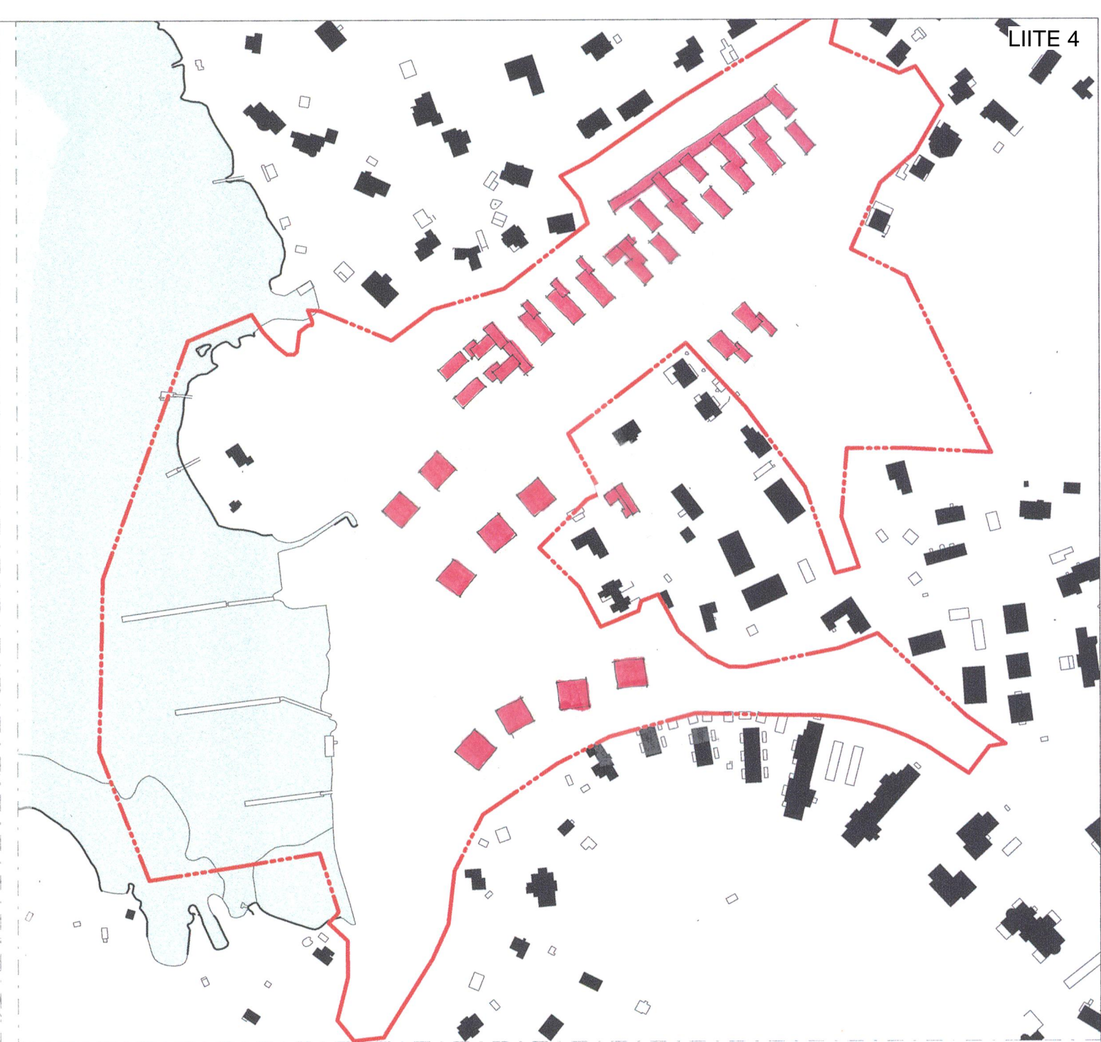
2 RAKEISUUS 1 : 3000