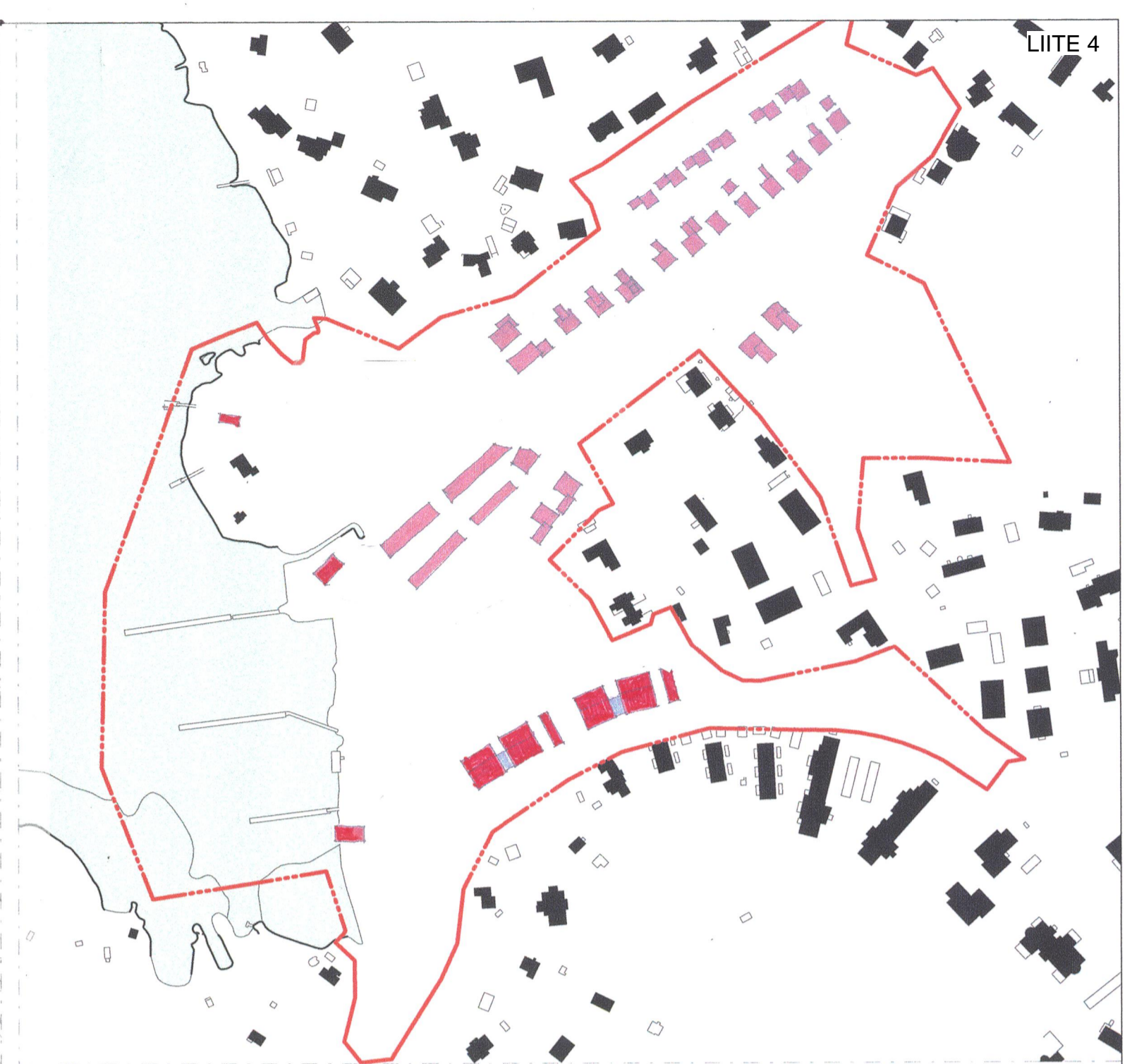
2 RAKEISUUS 1 : 3000