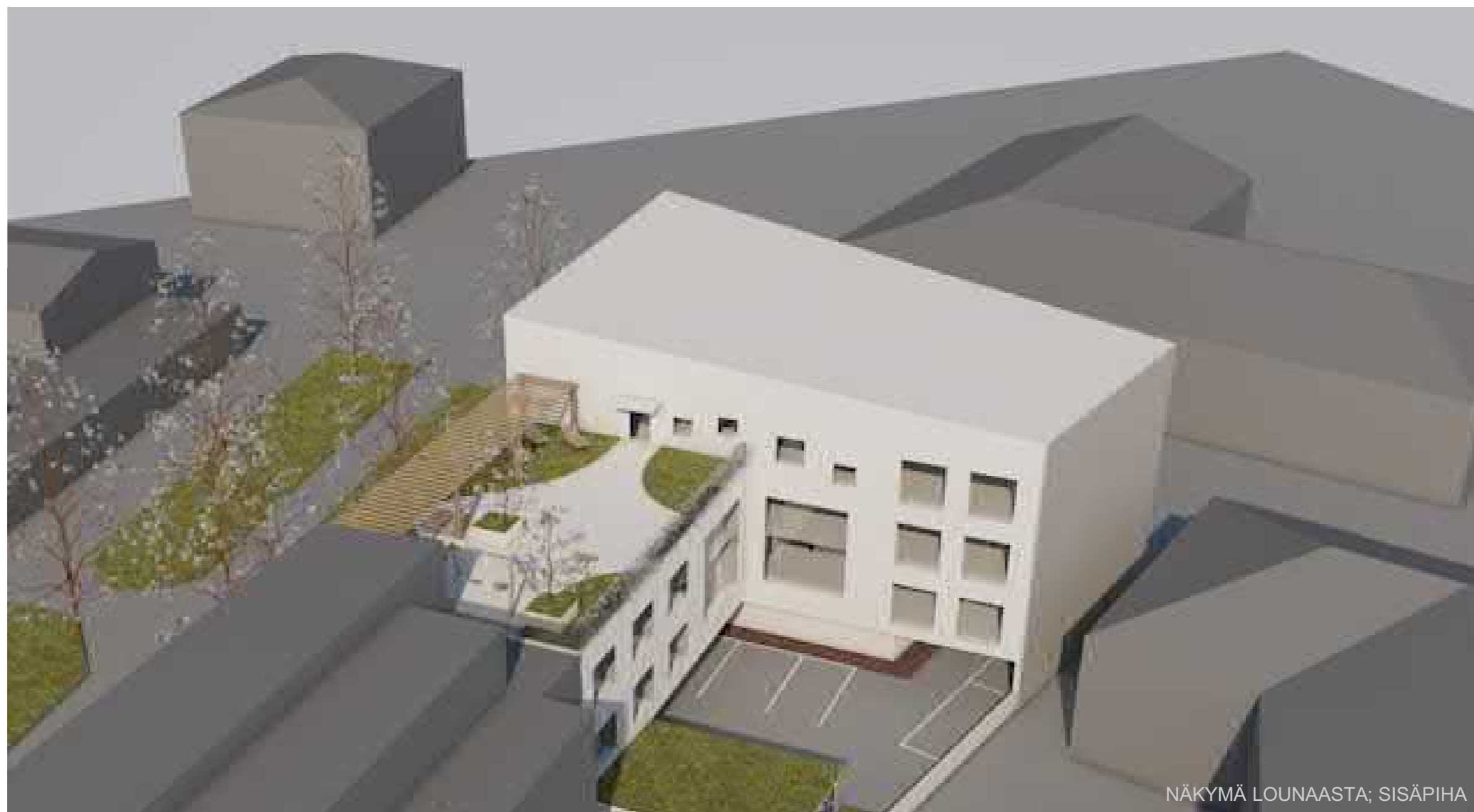
NÄKYMÄ LOUNAASTA; SISÄPIHA