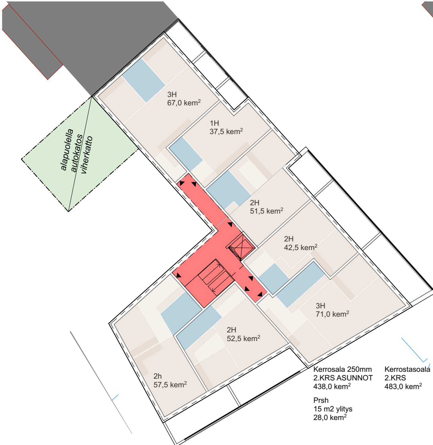
2. KERROS 3. KERROS

Kerrosala 250mm 2.KRS ASUNNOT 438,0 kem 2 Prsh 15 m 2 ylitys 28,0 kem 2 Kerrostasoala 2.KRS 483,0 kem 2