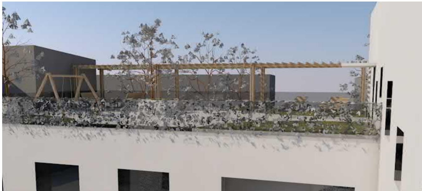
OLESKELUPIHA 3. KERROKSEN KATOLLA, NÄKYMÄ PUUSTOON