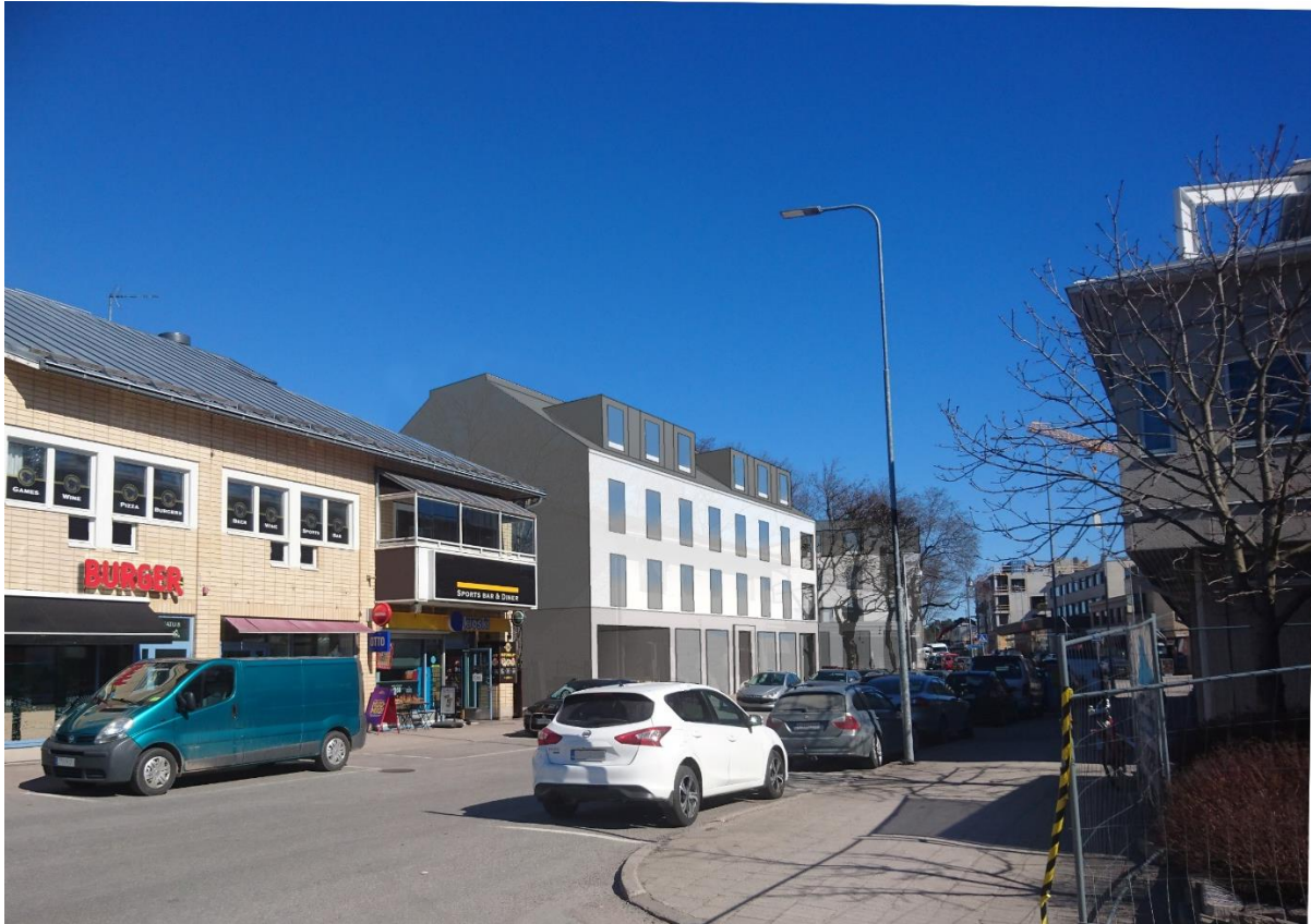
Birgitan talo nähtynä etelästä Tullikadulta, kaavoittajan näkemys.