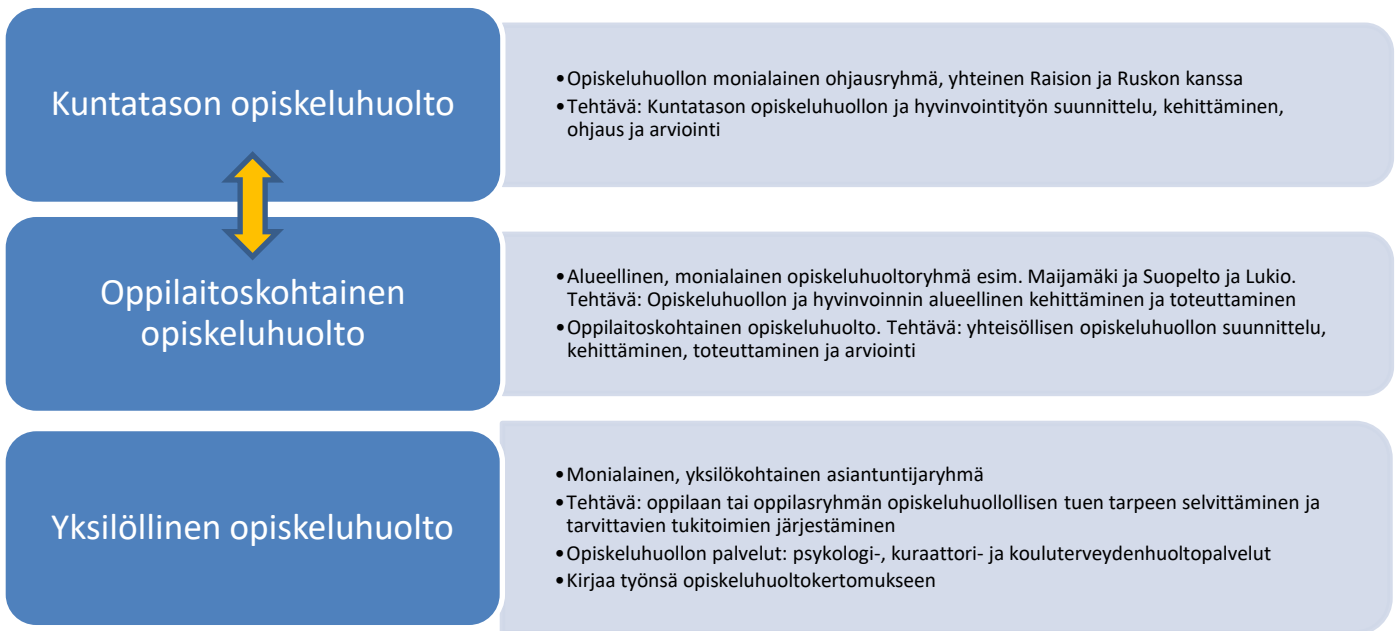
Taulukko 1. Opiskeluhoollon ja pedagogisten asioiden järjestämisen rakenne Naantalissa