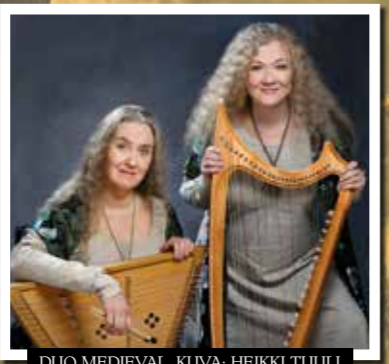
DUO MEDIEVAL.