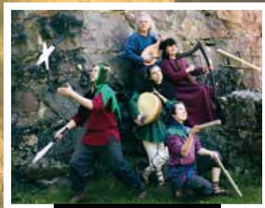
HÄRKÄTIEN LEIKARIT.