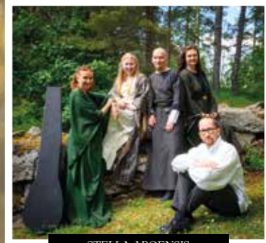
STELLA ABOENSIS KUVA: TUOMAS KOURULA.