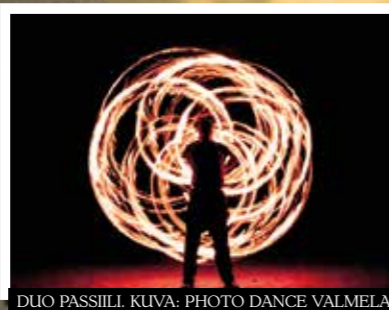
DUO PASSIILI.